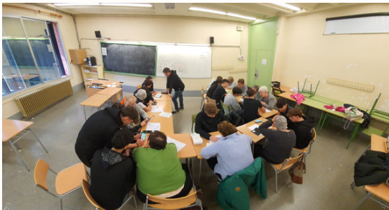
Primera sessió del projecte "Us ajudem" a l'Institut de Camprodon.

Durant el curs 2022/23, es va fer una prova pilot amb els alumnes de 4t d'ESO i va ser un èxit, amb molt bona participació per part dels alumnes i de les persones grans. Al curs 2023/24 s'ha realitzat la primera edició d'aquests tallers amb alumnes de 3r d'ESO i el funcionament ha estat satisfactori i es seguiran desenvolupant en els propers cursos.