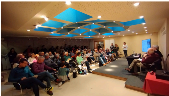
Assistents a una tertúlia a la sala de Cal Marquès (Camprodon)