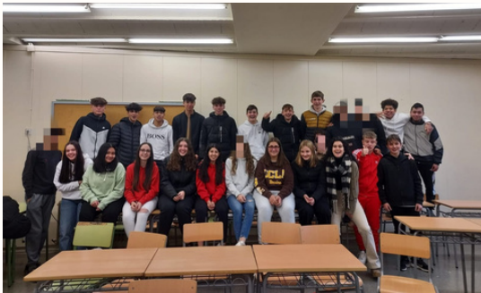
Alumnat de la primera edició del projecte de mentoria

Ja s'han desenvolupat dues edicions d'aquest projecte, totes dues amb un gran èxit en el seu funcionament i es continuarà realitzant. Les avaluacions tant per part dels estudiants com del professorat, famílies i mentors/es, han estat molt positives.